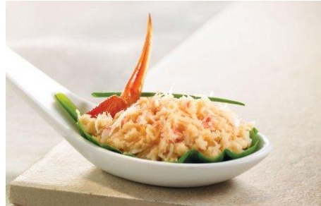
Rillettes de crabe fumé