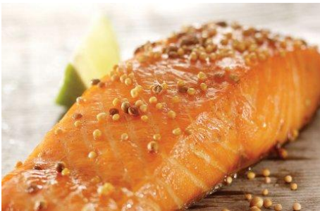
Rôti de saumon de l'Atlantique