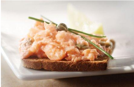
Rillettes de truite et crevettes fumées