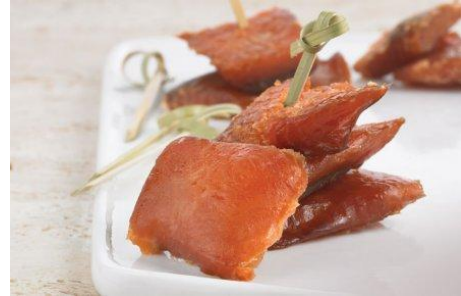
Bouchées de saumon au sirop d'érable