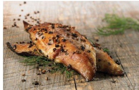
Maquereau fumé au poivre de malabar