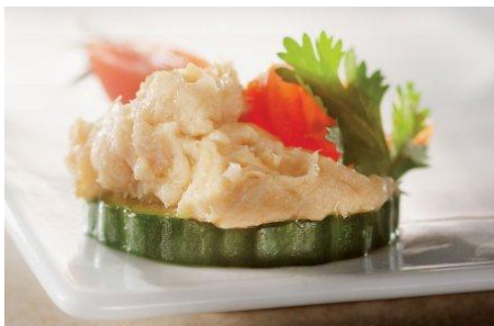
Rillettes de saumon fumé à la coriandre