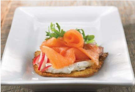
Saumon fumé à froid