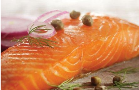
Pavé fondant de saumon de l'Atlantique