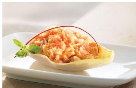
Rillettes de homard fumé